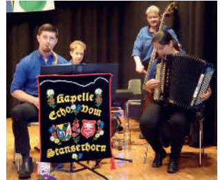
Echo vom Stanserhorn