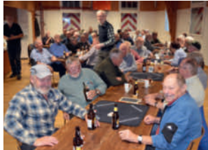
Gespanntes Warten auf die Preise