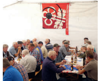
Pflege der Kameradschaft