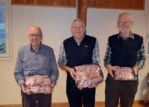
Die drei besten Jasser