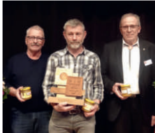
Gewinner Jahresschiessen Pistole