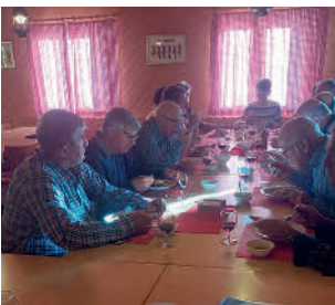
Obmännertagung in Emmetten mit Imbiss und Jass

Als Dank für ihre Arbeit für den VNSV werden die Obmänner jährlich vom Vorstand zur Obmännertagung eingeladen. Die Tagung dient dem Gedanken Austausch und Einbringen von Anliegen. Teilweise werden auch Beschlüsse gefasst. Zur Tagung gehört auch der obligate Jass und anschliessendem Imbiss. Die Organisation obliegt turnusgemäss einer Ortsgruppe.