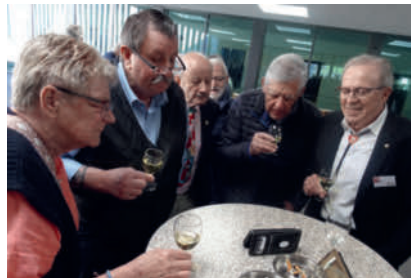
Beim Apéro Odi's Rennen am Handy verfolgen