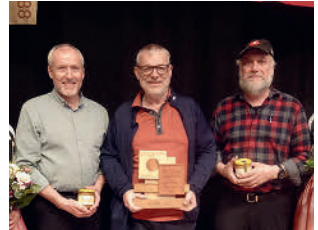
Gewinner Jahresschiessen 300m