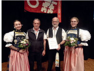
Neuer und alter Fährnich