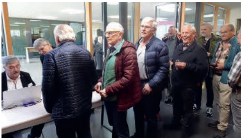
Erstmals werden Essen-Bon für Fr. 10.- abgegeben

Für die Verbandsarbeit und die investierten Stunden zur Verfassung des Protokolls und zum Gestalten und Erstellen des GvB spricht Präsident Dölf dem Sekretär den besten Dank aus.