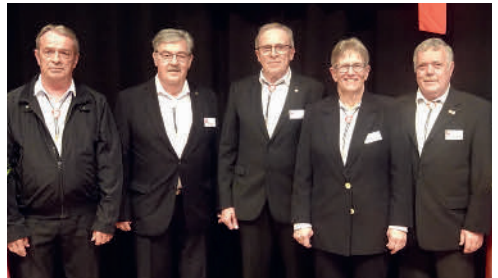
Der Vorstand VNSV 2025

Aus der Versammlung stellt sich niemand einer Kampfwahl 😊 und darum werden die beiden bisherigen Vorstandsmitglieder mit kräftigem Applaus wiedergewählt.