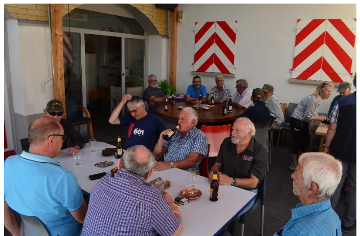
Philosophieren nach dem Gewehr-schiessen