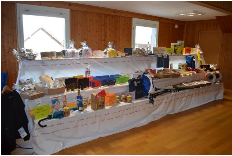
Sehr imposanter Gabentempel