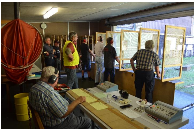
Schiessbetrieb Pistole 25m