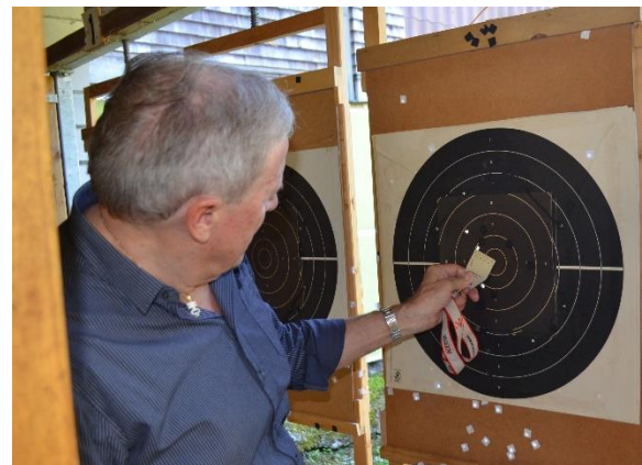
Auswertung Ehregaben 25m