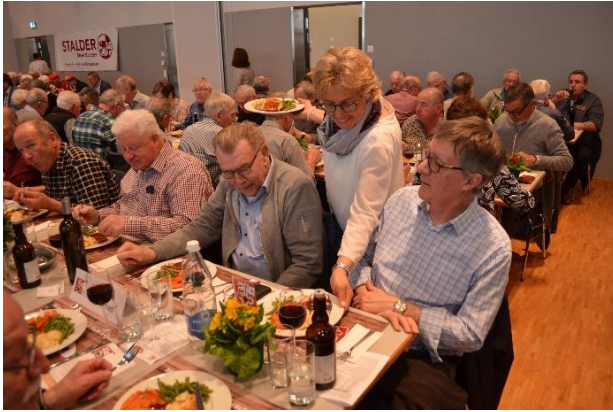
Essen wird serviert