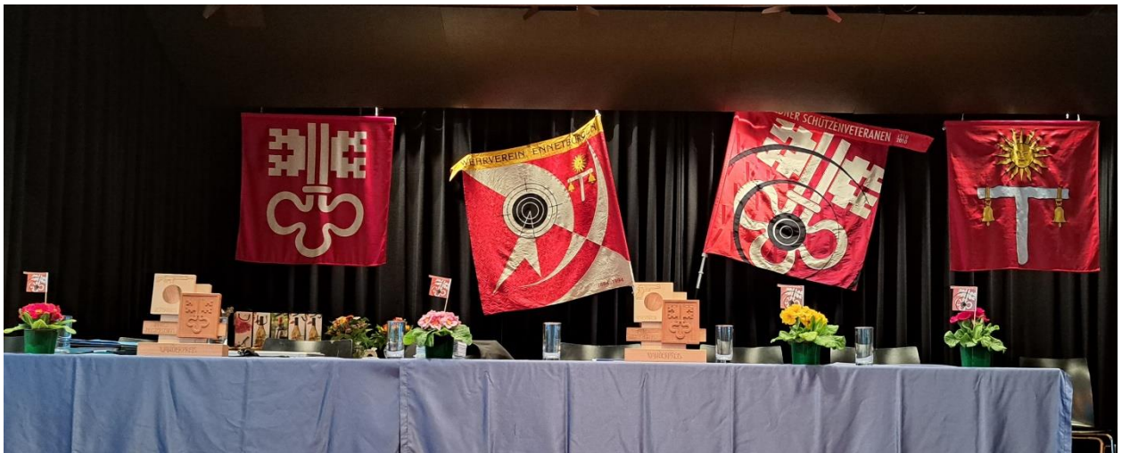
Unsere Fahnen: Nidwalden / Wehrverein Ennetbürgen / Verband NW-Schützenveteranen / Gemeinde Ennetbürgen