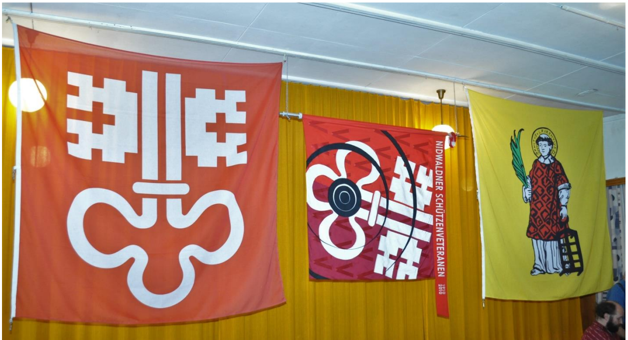
Nidwaldner-, VNSV- und Dallenwiler-Fahnen