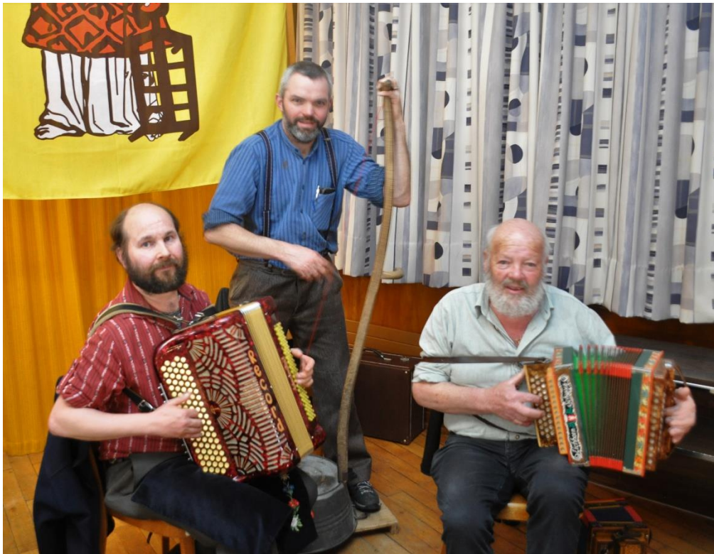
Das Trio „Gmüetlichkeit“ sorgte für Unterhaltung